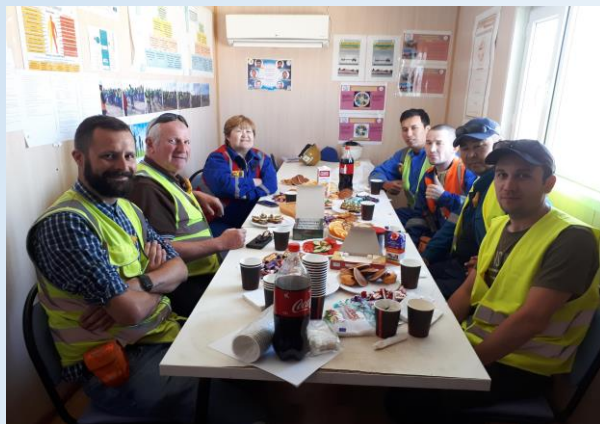
22.05.2019г. На фото чаепитие наших сотрудников с представителями ПБР